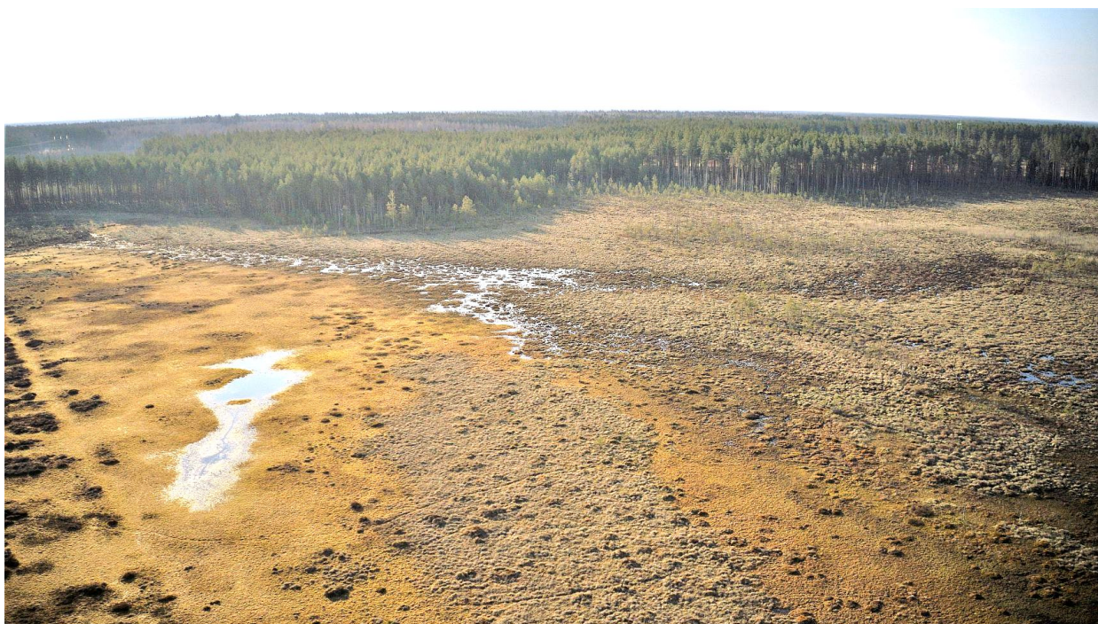
2. attēls. Pukšu purvs un izvērtējamā elektropārvades līnija tā DA malā (fotografēts no drona;).