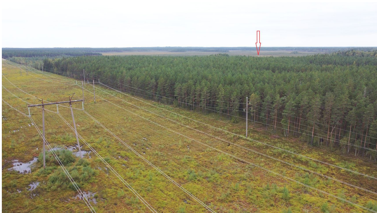
4. attēls. 11. – 12.09.2020. reģistrētā nakšņojošo dzērvju aptuvenā koncentrācijas vieta Pukšu purvā un EPL posms iepretim, kuru dzērves šķērsoja pārlidojumā naktī un no rīta (fotografēts no drona;).