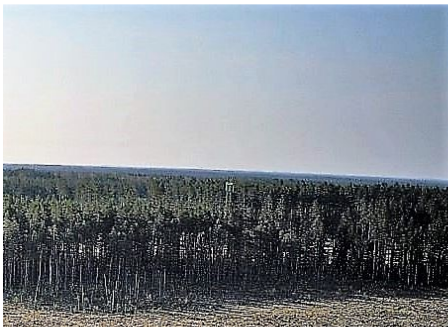
3. attēls. Pukšu purvs un izvērtējamā elektropārvades līnija tā DA malā (fotografēts no drona; šeit izkadrēts attēls no pielikuma 2. attēla augšējā labā stūrā).