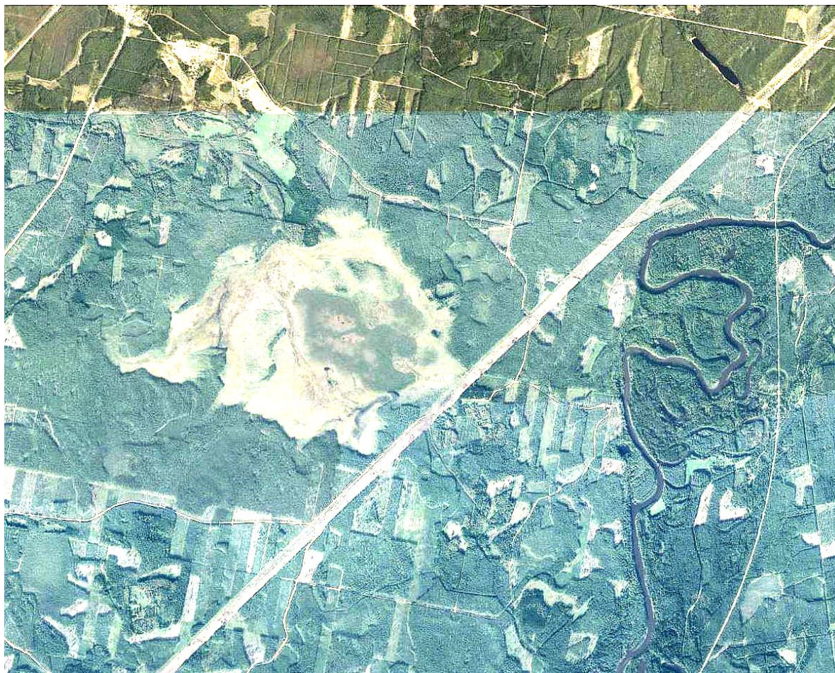
1. attēls. Pukšu purvs un izvērtējamā elektropārvades līnija tā DA malā (2015. – 2016. gada situācija; attēla avots http://kartes.lgia.gov.lv/karte/ ).