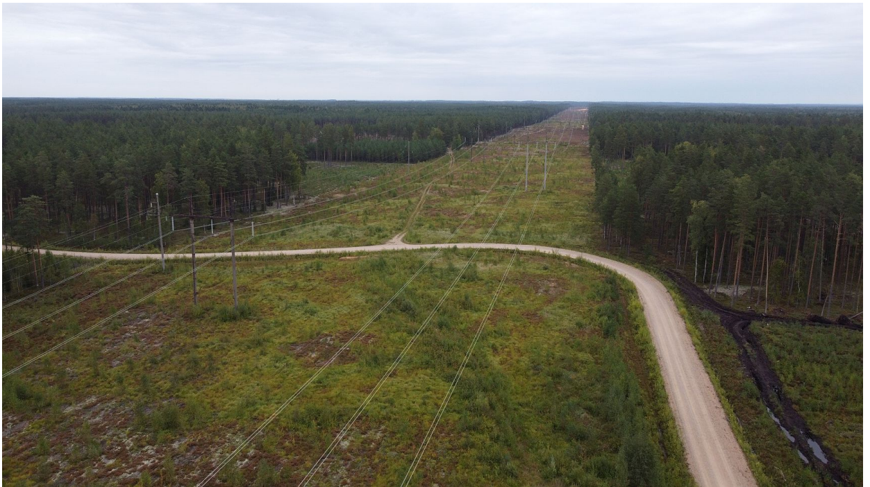
5. – 6. attēls. Izvērtējamais EPL posms (fotografēts no drona;).